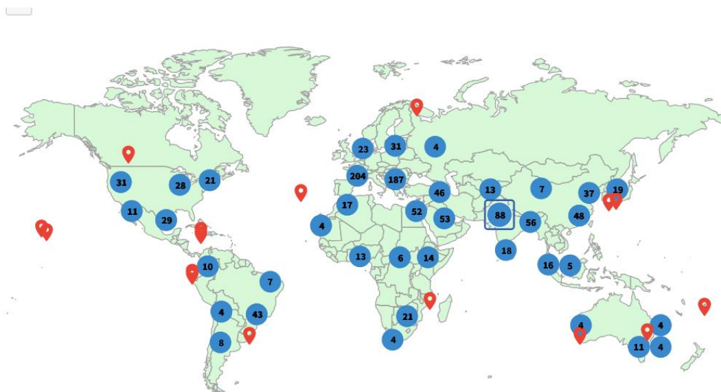
Διάγραμμα 2. Γεωγραφική κατανομή αναφορών (Web of Science, Σεπτέμβριος 2024)